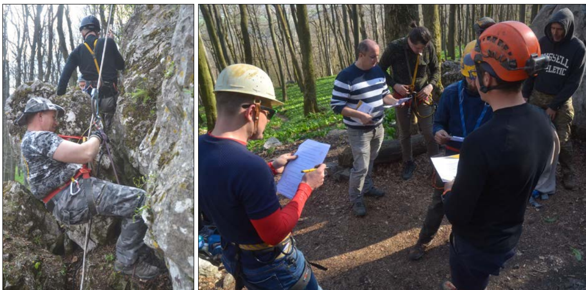
Nácvik na stene a vyplňovanie testov s následnou kontrolou správnosti a diskusiou s inštruktormi.

Kurz prebiehal počas príjemného jarného počasia, ktoré sa podpísalo na skvelej nálade jednotlivých účastníkov. Bohatý program sa podarilo splniť do skorých večerných hodín.